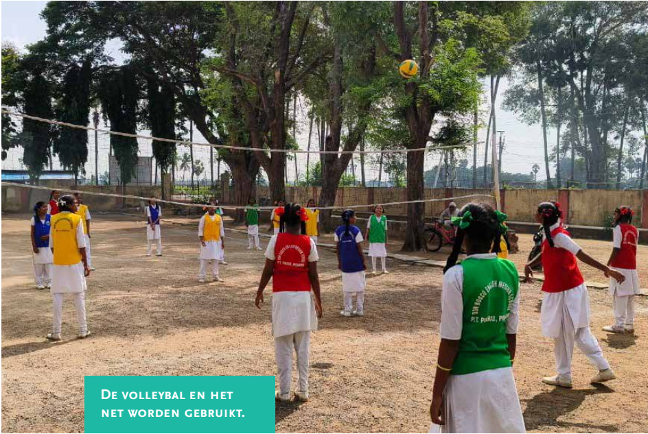
DE VOLLEYBAL EN HET NET WORDEN GEBRUIKT.

Naast de beurzen voor 21 meisjes die een Engelstalige opleiding krijgen op de Don Bosco School in Andhra Pradesh, hebben we afgelopen jaar ook geld gegeven voor nieuwe sportmaterialen.