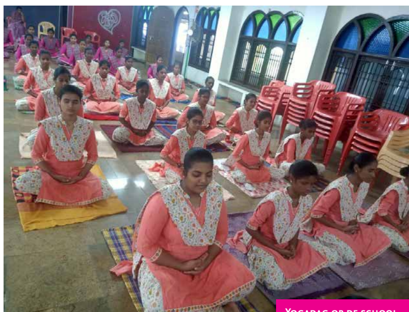
YOGADAG OP DE SCHOOL.

De 12 studentes die in 2021 zijn gestart met hun studie verpleeg- en verloskunde aan de St. Theresa of Child Jesus school of Nursing studeren in de zomer van 2024 af. De school is verbonden aan het St. Thomas Hospital.