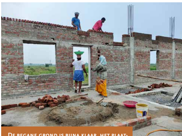
DE BEGANE GROND IS BIJNA KLAAR, HET PLAATSEN VAN DE ROOF SLAB WORDT VOORBEREID.

Stichting Amaidhi doneerde 2000,- euro voor een deel van de ommuring en het onderkomen van de beveiliging. SAVE Trust had al de onder-