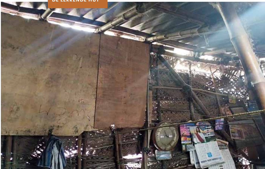
DE LEKKENDE HUT

Wij hopen dat u als lezer van deze nieuwsbrief ook een bijdrage wil leveren. U kunt een bedrag naar eigen inzicht overmaken naar rekening NL76 RABO 0167944681 van Stichting Amaidhi Nijmegen ovv 'Huis Sugumaran'. Groot of klein, alle hulp is welkom! En zoals altijd wordt uw gift voor 100 procent besteed aan het project.