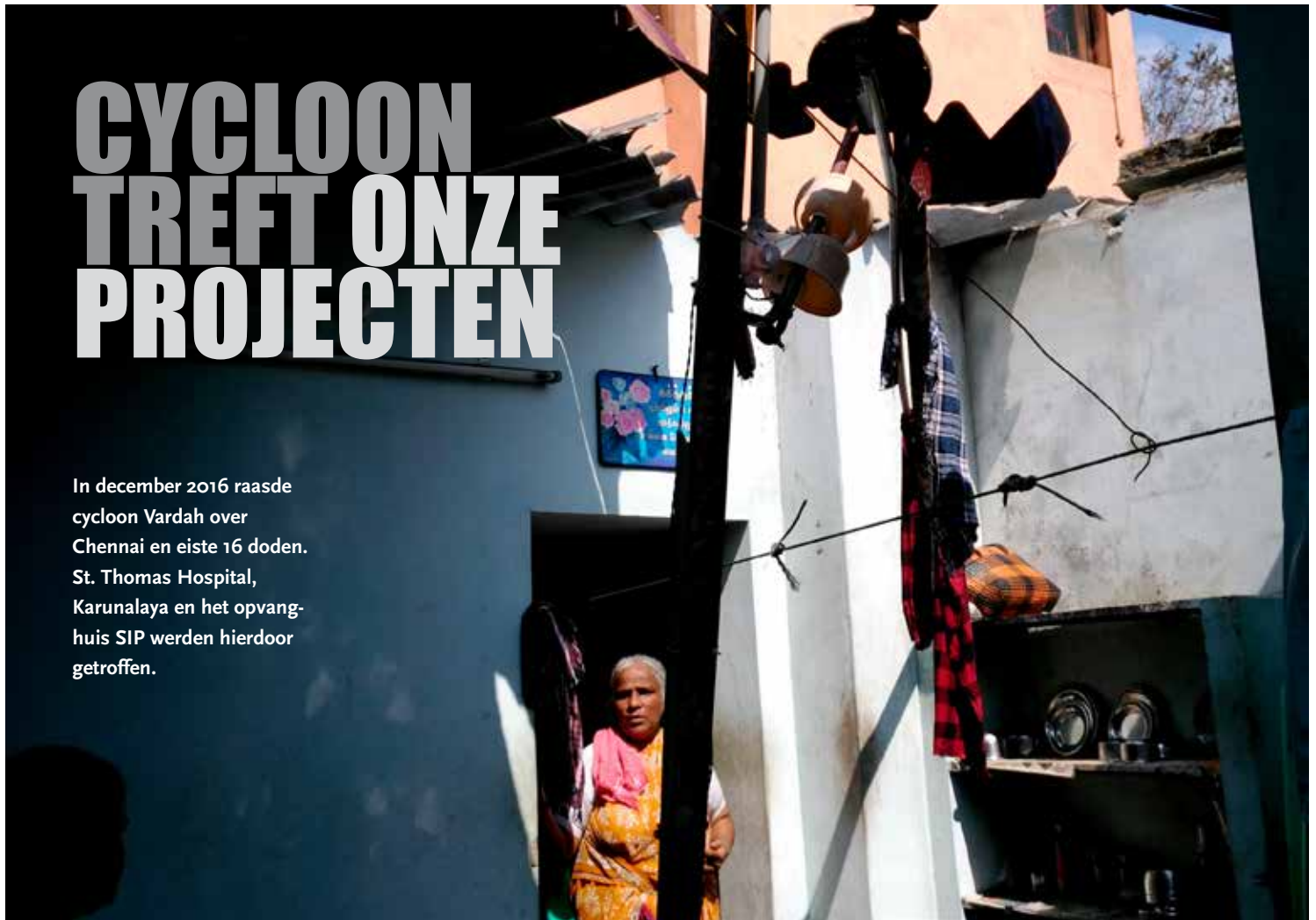
EEN BESCHADIGDE HUT IN DE BUURT VAN KARUNALAYA

In december 2016 raasde cycloon Vardah over Chennai en eiste 16 doden. St. Thomas Hospital, Karunalaya en het opvanghuis SIP werden hierdoor getroffen.