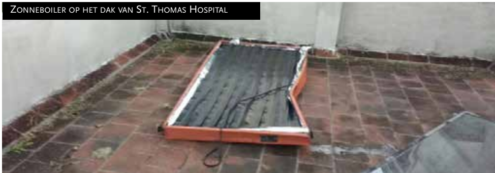
ZONNEBOILER OP HET DAK VAN ST. THOMAS HOSPITAL