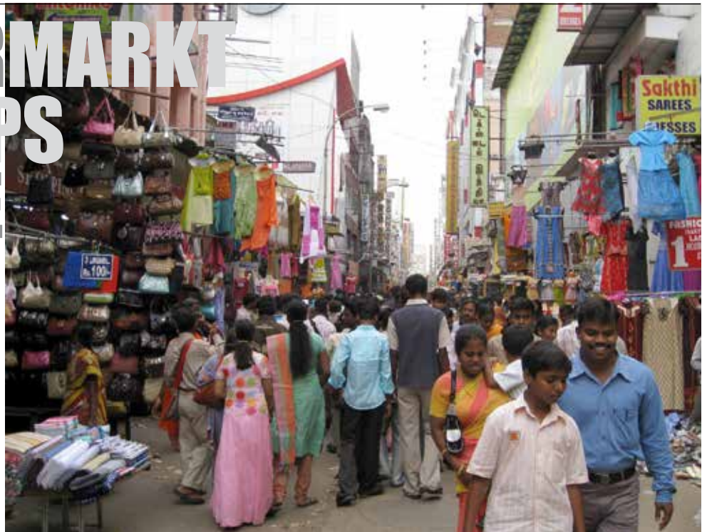
EEN WINKELSTRAAT IN CHENNAI