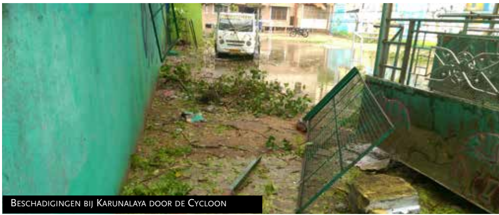
BESCHADIGINGEN BIJ KARUNALAYA DOOR DE CYCLOON