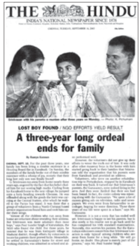
EEN DEEL VAN DE JONGENS DIE IN HET SHELTER WORDEN OPGEVANGEN