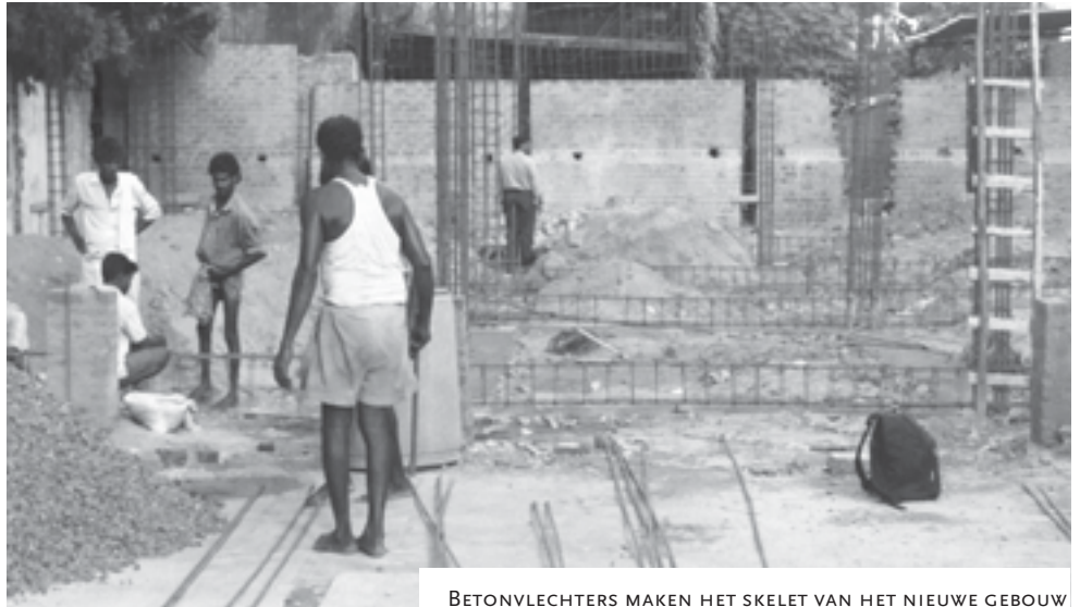
BETONVLECHTERS MAKEN HET SKELET VAN HET NIEUWE GEBOUW