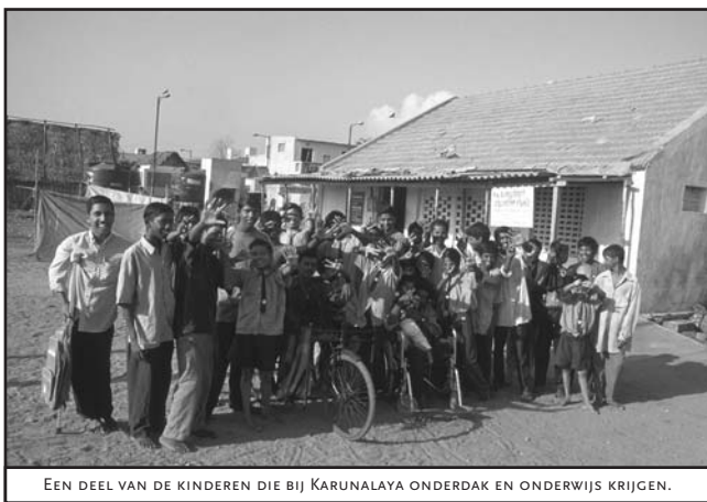
EEN DEEL VAN DE KINDEREN DIE BIJ KARUNALAYA ONDERDAK EN ONDERWIJS KRIJGEN.