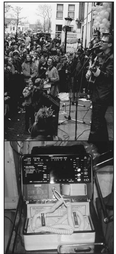
Foto boven: de Utrechtse woon/werkgemeenschap Predikherenkerkhof feestte tijdens koninginnedag 2350 gulden bijeen. Foto onder: de defibrillator is inmiddels door het St. Thomas Hospital aangeschaft.

Rexline heeft altijd veel plannen voor projecten in en om het ziekenhuis. Amaidhi heeft niet genoeg geld om die allemaal te steunen. Toch willen we voor een aantal van die projecten ons best doen externe fondsen te werven en als tussenpersoon op te treden. Ook voor projecten van andere Indiase vrienden willen we intermediair zijn. Meer hierover leest u in het hoofdstukje Fondsen - Amaidhi gaat de boer op.