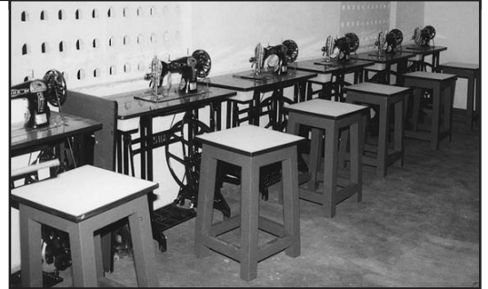
Foto boven: de drukbezochte opening van het Chennai Tailoring Team in maart van dit jaar.

Wij hebben gevraagd of de vrouwen speciaal voor onze stichting tassen en rugzakken willen naaien. Die willen we