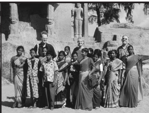
'In Mahabalipuram kregen ze een rondleiding langs de tempels'