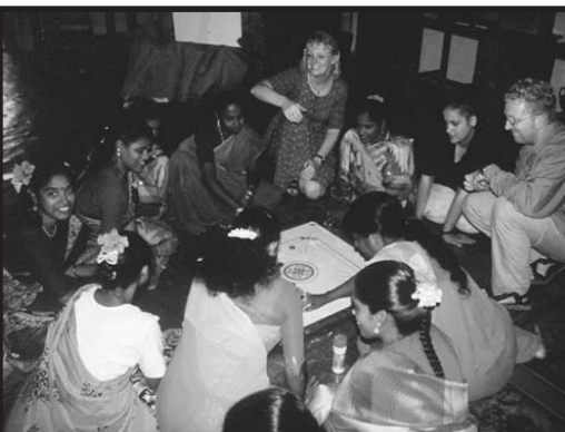
Er werd fanatiek 'carramboard' gespeeld.