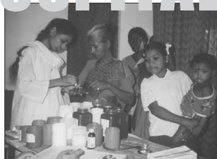
'Het educatieproject gericht op basiszorg in de dorpen waar het ziekenhuis poliklinieken exploiteert, heeft vorig jaar ook een bijdrage ontvangen.'

exploiteert, heeft vorig jaar ook een bijdrage ontvangen. Het is een project dat zijn effectiviteit heeft bewezen. De Indiamarkt die we hebben gehouden heeft voldoende geld hiervoor opgeleverd.