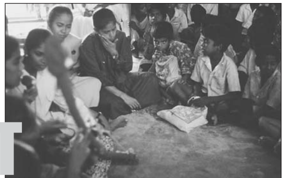
gezondheidsvoorlichting door de verpleegkunde-studentes

Amaidhi heeft besloten weer een bijdrage te leveren aan de gezondheidsvoorlichting door de verpleegkunde-studentes van Rexline's School of Nursing. Dat educatieproject gericht op basiszorg in de dorpen waar het ziekenhuis poliklinieken