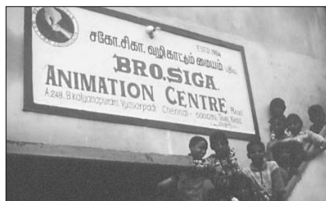
Wijkcentrum 'Bro. Siga animation centre'

ons dat dan weten. Adressen en telefoonnummers vindt u in het colofon.